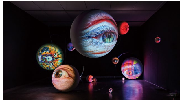
《スペキュラー》2021年、本展のための展示スケッチ

暗闇の中に浮かぶ大小さまざまな「眼」の玉のインスタレーション。鑑賞者は巨大な「眼」の群れに囲まれ、その表面に映り込むメディアの断片を目にするとともに、覗き見られる体験と鑑賞者自身が見る体験の循環を経験します。本作品は、現代の視聴文化における鑑賞者の位置を問う作品です。アウスラーにとって「眼」は重要なモチーフであり、彼は「眼」とは、私たちがイメージや物語を消費し続ける飽くなき欲求の象徴だと語ります。1995年から「眼」というモチーフを探求し続け、そのテーマと表現技法を常にアップデートしてきた現在進行形のプロジェクトです。