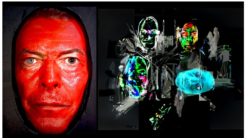
左:《空(くう)》の映像からの静止画 2000年、デヴィッド・ボウイ、グレン・ブランカとの共作

本作は、アウスラー主導のプロジェクトであり、モノリス(巨大な石)にデヴィッド・ボウイによる語りのパフォーマンス映像を投影し、ギタリストのレグ・ブローを起用したエレキギターを駆使したスタイルで知られる作曲家グレン・ブランカによる特別な音楽を融合させた作品です。カメラ・オブスクラへの思索や、私たちの仮想世界を形作るために物質が光へと変容していく様への思索として着想されました。アウスラーによる詩的なテキスト、音楽、パフォーマンスを絶え間なく再構成し続け、重層的かつ変容し続ける体験を生み出します。映像自体は1999年から2000年に撮影されたものですが、《空》が完成した作品として完全に具現化され、展示されるのは本展が初となります。