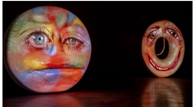
《カリカチュア》2003-2004年 展示風景:「Tony Oursler: Black Box」高雄市立美術館(台湾) 2021年

このシリーズは、再構成された顔のパーツを立体物に投影することで、豊穣のシンボルとなる偶像や、デジタル空間の中で進化したかもしれない生命体を彷彿とさせるインスタレーションです。漫画や古代彫刻を参照した表情は絶えず変化し、甘えや囁きといった声を発することで、奇妙に擬人化された存在として立ち現れます。日本の携帯ゲーム「たまごっち」に着想を得た本作は、デジタル空間における生命のようです。愛らしさと不気味さが同居する中で、テクノロジー、感情、そして身体性の境界が揺さぶられます。