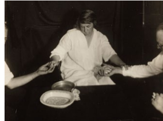
上:《計り知れないもの》2015-2016年